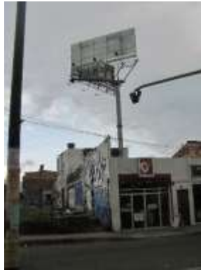
VISTA PANORÁMICA DEL ELEMENTO DE PUBLICIDAD EXTERIOR VISUAL TIPO VALLA TUBULAR COMERCIAL INSTALADO – SENTIDO OESTE – ESTE: SIN PUBLICIDAD